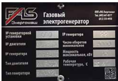
Рис. Табличка-шильда паспортных данных генераторной установки

Каждая генераторная установка имеет идентификационный номер, указанные на фирменном ярлыке-шильде (см. рис.), прикрепленном к основанию. Эта шильда содержит информацию о дате изготовления, напряжении, токе, мощности в кВА и кВт, частоте, коэффициенте мощности и массе генераторной установки. Эти данные необходимы для оформления заказов на запасные части, обоснования гарантии и заявок на сервисное обслуживание.