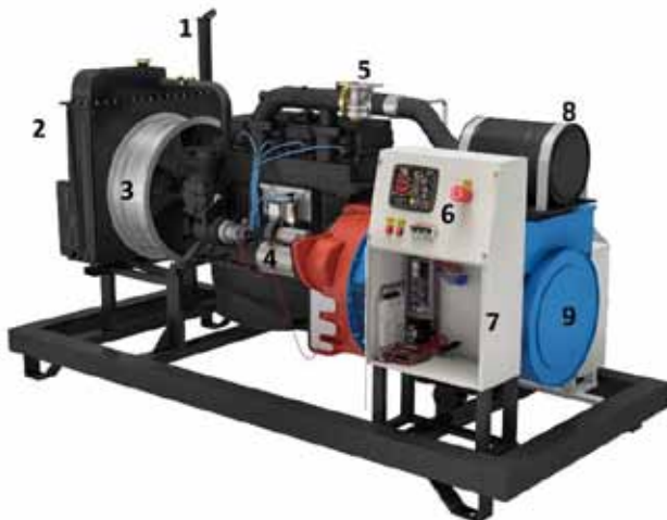
Рис. Генераторная установка ФАС-50-3/М

Для осуществления контроля и управления выходной мощностью и защиты от возможных сбоев в работе установка оснащена контроллером (подробная информация о настройке контроллера – в разделе 9).