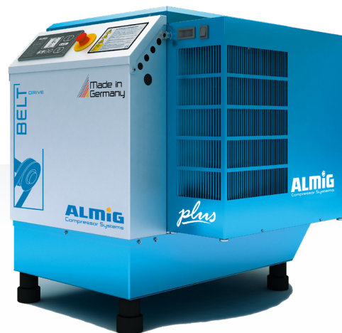
BELT 4-37 "PLUS"